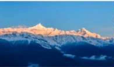
ภูเขาหิมะเหมยลี่